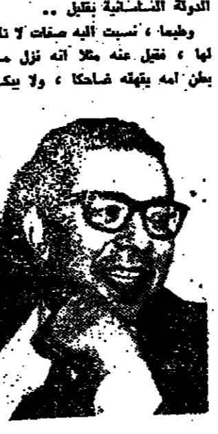
بقلم : احمد بهاء الدين

كما تم إنتاج حياة السيد المسيح من جديد في إنتاج هوليودي ضخم بذات الاسم القديم الذي كان قديمه دي ميل سابقاً وهو «ملك الملوك» ومن بطولة الممثل المعروف آنذاك على نطاق واسع جيفري هنتر .